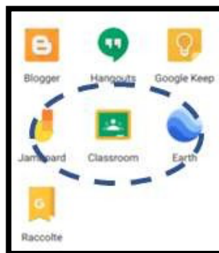
Figura 1 - Icona identificativa dell'applicazione Classroom

Per utilizzare lo strumento è necessario accedere alla propria casella di posta elettronica Gmail 1 ; quindi si deve accedere al menu di google e cliccare su CLASSROOM (Figura 1). In alternativa, dopo aver effettuato l'accesso con le proprie credenziali di posta, è possibile accedere all'applicazione CLASSROOM direttamente dal link https://classroom.google.com/ .